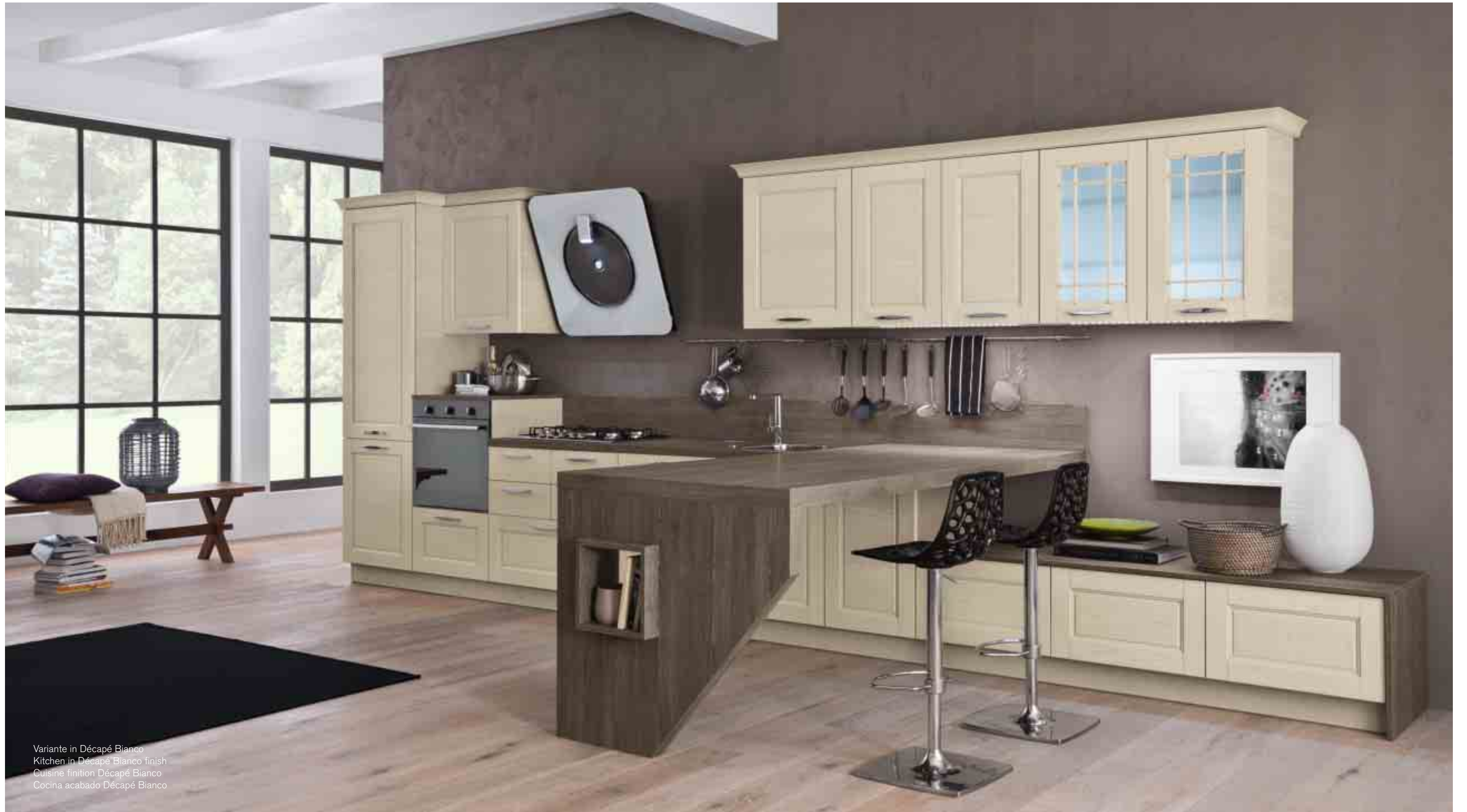
Variante in Décapé Bianco Kitchen in Décapé Bianco finish Cuisine finition Décapé Bianco Cocina acabado Décapé Bianco