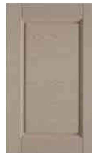
Décapé Ecrú (065)