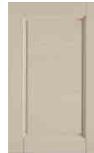
Décapé Bianco (063)