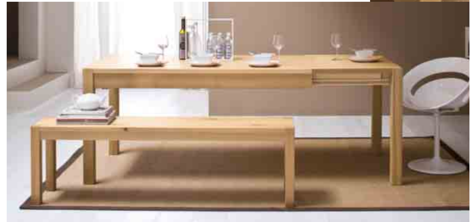
TAVOLO QUADRATO PEGASO IN ROVERE MASSICCIO ALLUNGABILE