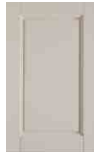
Laccato bianco Ral 9003 (020)