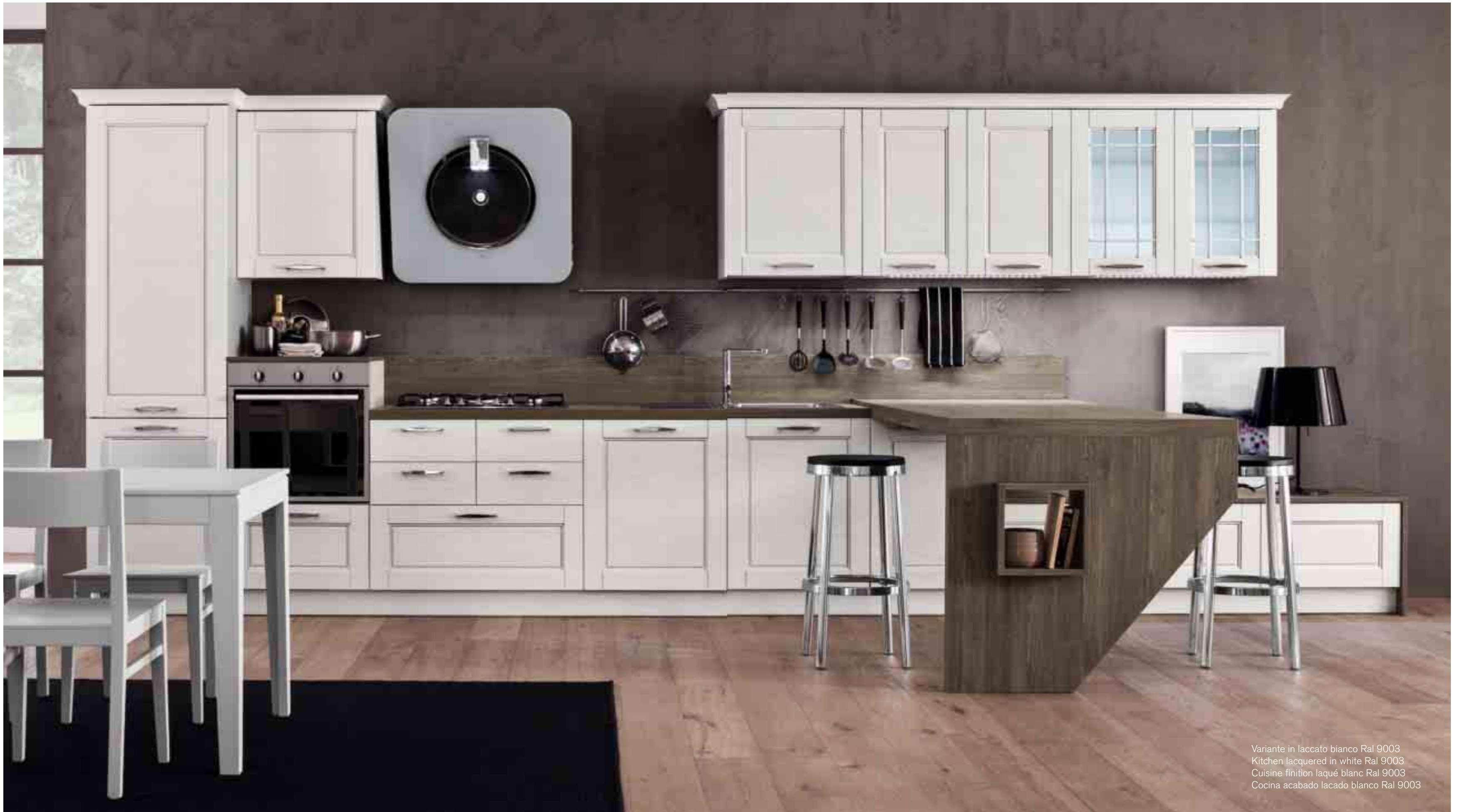
Variante in laccato bianco Ral 9003 Kitchen lacquered in white Ral 9003 Cuisine finition laqué blanc Ral 9003 Cocina acabado lacado blanco Ral 9003