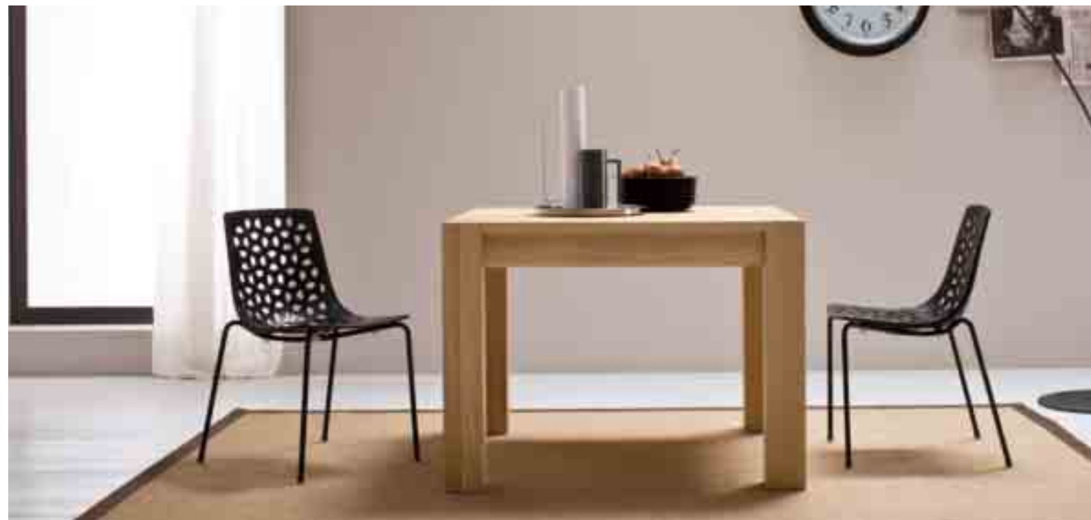
TAVOLO QUADRATO ERCOLE IN ROVERE MASSICCIO ALLUNGABILE