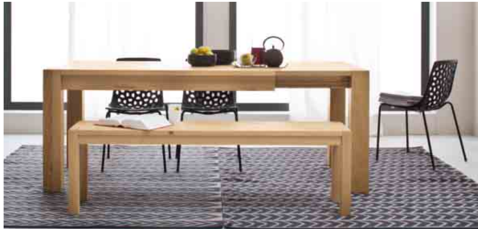
TAVOLO QUADRATO ERCOLE IN ROVERE MASSICCIO ALLUNGABILE